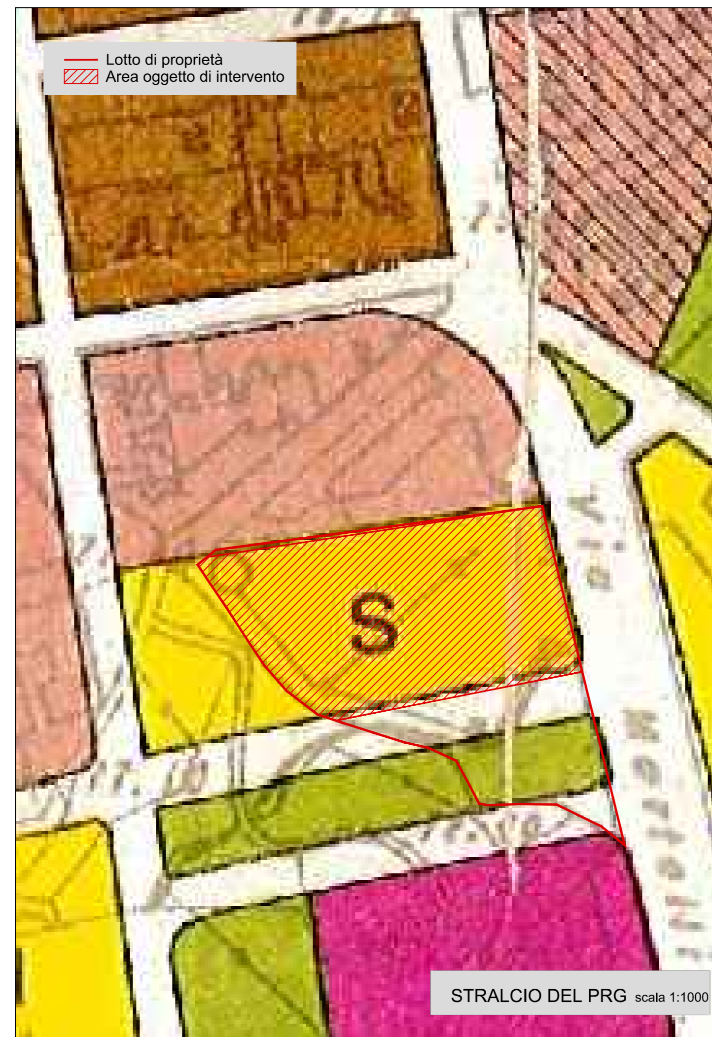
STRALCIO DEL PRG scala 1:1000