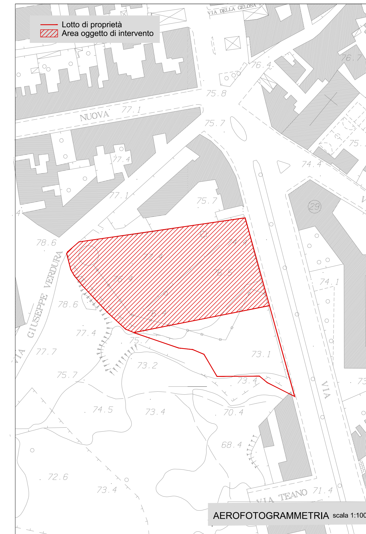
AEROFOTOGRAMMETRIA scala 1:1000

20-Lug-2017, 14:59:23 Prof. n. T225090/2017 Scala originale: 1:1000 Dimensione cornice: 388.000 x 276.000 metri Comune: CATANIA/A Foglio: 21 A11-A