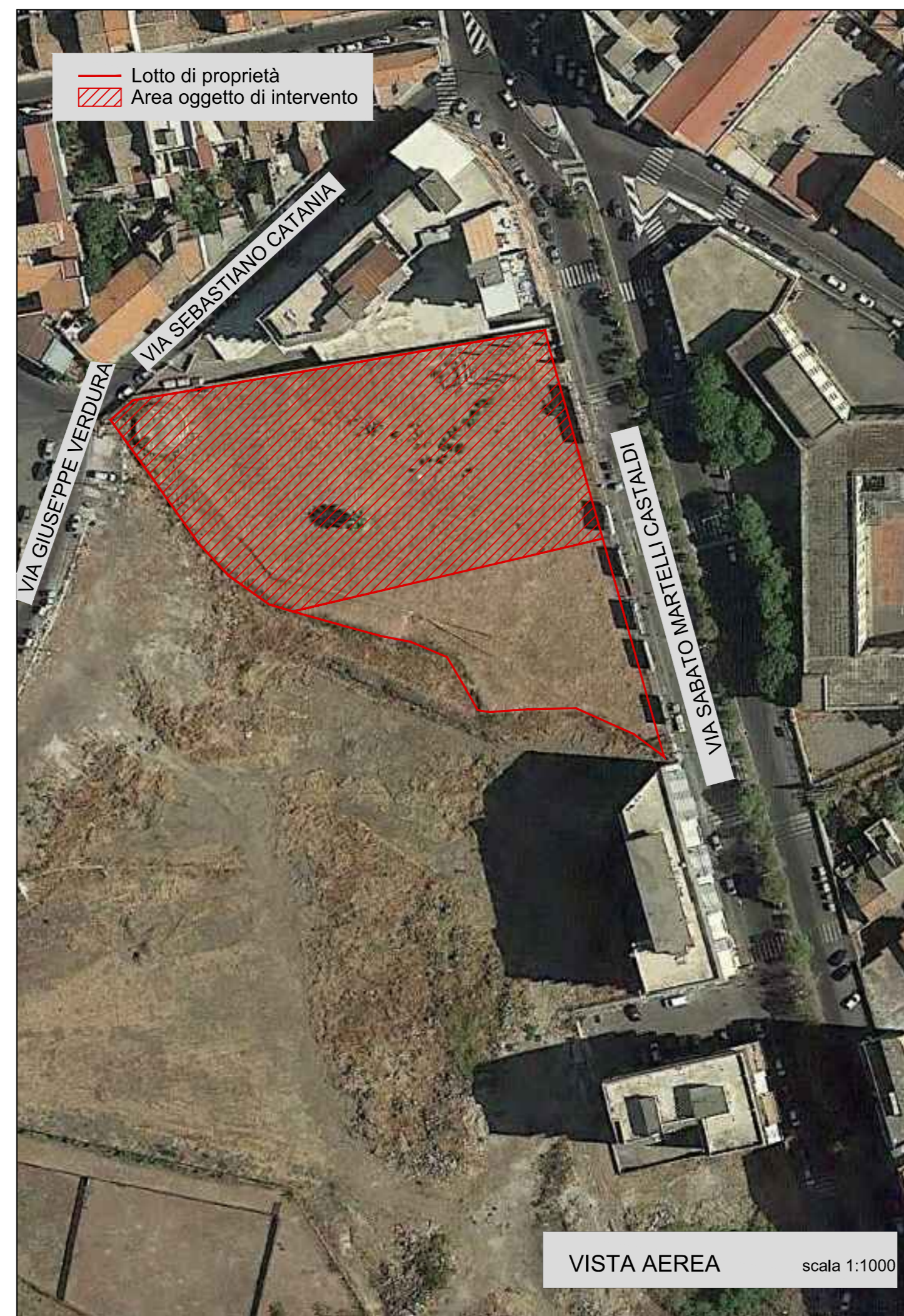
VISTA AEREA scala 1:1000